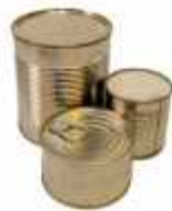
Latas de conserva, atún, sardinas...

Colabora con nosotros aportando cualquiera de las siguientes necesidades: