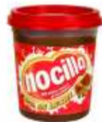
Comida para untar, foie, paté...