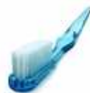
Cepillos de dientes